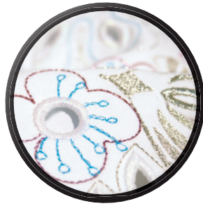
creative sensation™ pro